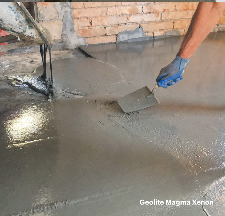
Geolite Magma Xenon