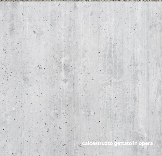
calcestruzzo gettato in opera