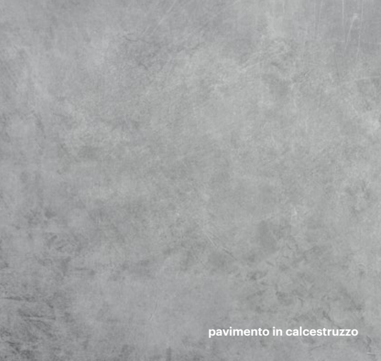
pavimento in calcestruzzo