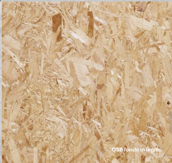
OSB fondo in legno