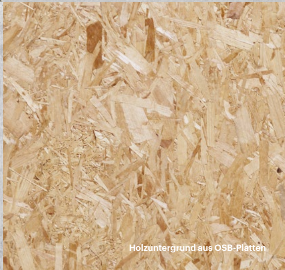
Holzuntergrund aus OSB-Platten