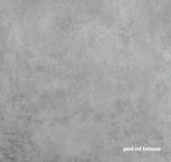
pod od betona