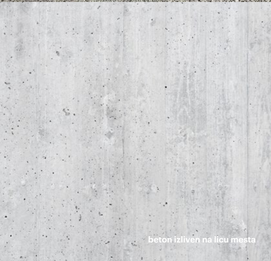
beton izliven na licu mesta