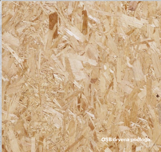
OSB drvena podloga