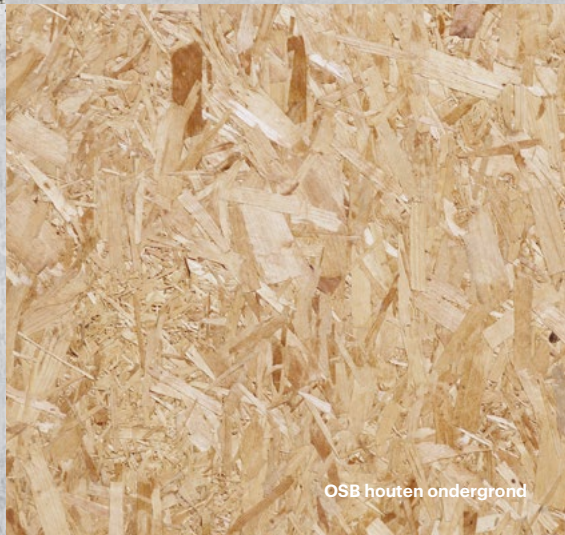
OSB houten ondergrond