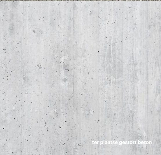
ter plaatse gestort beton