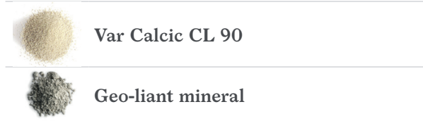
Var Calcic CL 90