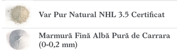
Var Pur Natural NHL 3.5 Certificat