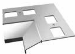
Narożnik wewnętrzny 90° Aquaform Basic NW90