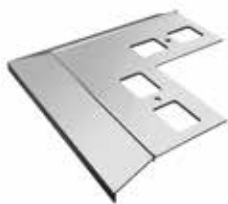
Narożnik zewnętrzny 90° Aquaform Basic NZ90