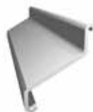
Łącznik Aquaform Basic L